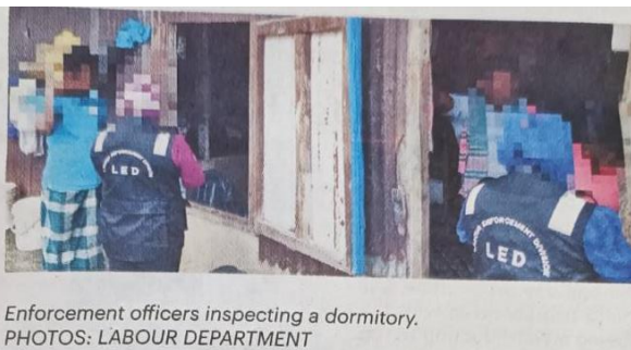
Enforcement officers inspecting a dormitory.

กรมแรงงานบรูไน ได้ประกาศเตือนนายจ้างให้ดูแลสวัสดิการของแรงงานต่างชาติตามข้อกำหนดของกฎหมายแรงงาน ๒๐๐๙ เช่น จัดทำสัญญาจ้างงาน กำหนดตารางเวลาจ่ายเงินเดือน ไม่ใช่ใบอนุญาตทำงานคนต่างชาติในทางที่ผิดกฎหมายแรงงาน ๒๐๐๙